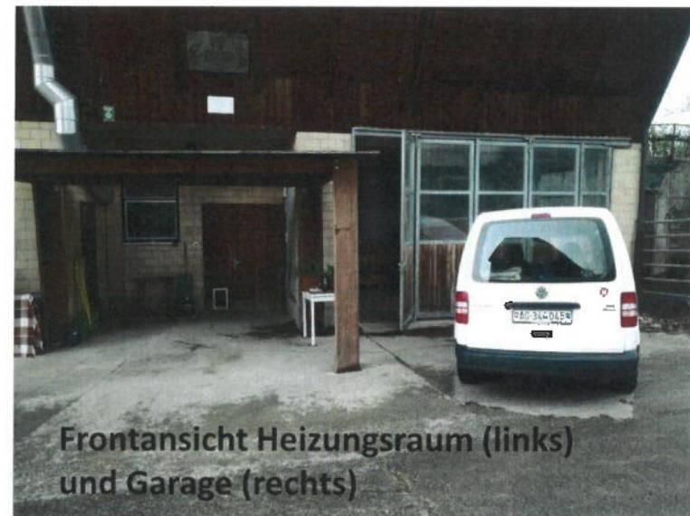
Frontansicht Heizungsraum (links) und Garage (rechts)