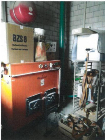
Bestehende Holzchnitzel- Feuerung mit Schnitzelzu- führung (grünes Rohr)