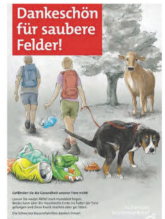
Die Tafeln können beim LBV bezogen werden: https://www.luzernerbauern.ch/shop.html

In der Verordnung über das Halten von Hunden finden Sie weitere Details.