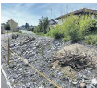
Neu gestaltete Ruderalflächen in Gunzwil.

Weil solche Flächen heute selten geworden sind, bieten speziell dafür angelegte Ruderalflächen einen wichtigen Ersatzlebensraum für Wildblumen, seltene Pflanzen, Eidechsen, Vögel, Wildbienen und viele andere Insekten.