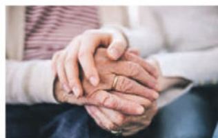
Es ist keine Anmeldung notwendig. Der Anlass ist kostenlos. Eine Kollekte wird aufgestellt. Wir freuen uns über eine rege Teilnahme.

Ein Themenkreisvortrag dauert 20 Minuten mit 10-minütiger Fragerunde. Nach zwei Vorträgen findet eine Pause statt. Am anschliessenden Apéro stehen die Expertinnen und der Experte für weitere Fragen und Gespräche in lockerer Atmosphäre zur Verfügung (Thementische).