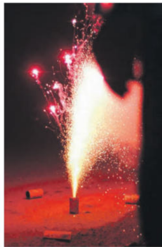
Feuerwerkabfall bitte einsammeln.

Auf den Geländen aller Schulhäuser der Gemeinde Beromünster (das gilt für alle Ortsteile) ist das Abrennen von Feuerwerk untersagt. Beim Abfeuern von Feuerwerkskörpern ist darauf zu achten, dass der Abfall anschliessend einzusammeln ist. Die Nachtruhezeiten sind einzuhalten. Im Kanton Luzern existieren keine einheitlichen Vorschriften. Rechtlich zwingend ist lediglich die Nachtruhe von 22.00 bis 6.00 Uhr. Im Sinne eines guten und friedlichen Zusammenlebens empfehlen wir jedoch folgende Ruhezeiten und Regeln einzuhalten: - Ruhezeiten: Werktags von 12.00 bis 13.00 Uhr und von 20.00 bis 7.00 Uhr. - An Samstagen werden keine Bauarbeiten vorgenommen, die störenden Lärm verursachen. - Als Ruhetage gelten die Sonntage sowie die allgemeinen Feiertage. Besten Dank für das Verständnis und die gegenseitige Rücksichtnahme.