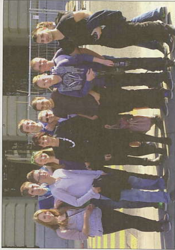
Gruppenfoto mit Bundesrätin Doris Leuthard.

Im Rahmen des Staatskundeunterrichtes reisten die vier Klassen der 3. Sekundarschule Beromünster am Montag, 26. März in die Schweizerische Hauptstadt. Während einer rund einstündigen Führung durch das Bundeshaus lernten die Schülerinnen und Schüler, dass die Kuppelhalle mit vielen Symbolen der Schweizer Geschichte ausgestattet ist. Weiter durften die Jugendlichen im Ständerats- und Nationalratssaal Platz nehmen und erfahren, dass Politik oft auch in der Wandelhalle betrieben wird. Aber nicht nur die Führung weckte Interesse, sondern auch die Anwesenheit einiger Parlamentarier und Bundesrätinnen, welche die Schülerinnen und Schüler zu Gesicht bekamen. Neben Simonetta Sommaruga sahen wir auch die aktuelle Bundes-