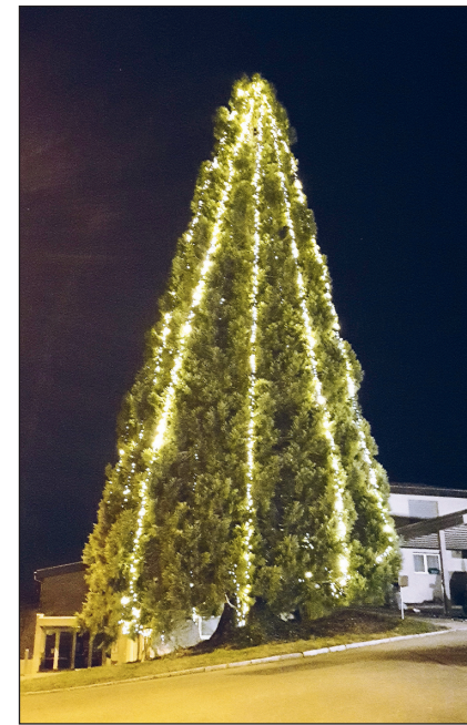
Der Weihnachtsbaum erstrahlt.

Die jährliche Weihnachtsdekoration in der Gemeinde Beromünster ist ein Gemeinschaftswerk – sehr zur Freude des Vereins Ortsmarketing 5-Sterne-Region. Ein herzliches Dankeschön an alle, die in irgendeiner Form einen Beitrag dazu leisten. Nur mit vereinten Kräften und grossem Engagement ist es möglich, die Dekorationen zu montieren und vorweihnächtlichen Lichterglanz in alle Ortsteile zu bringen. Die Mitwirkenden: Gewerbeverein, Gemeinde, Ortsmarketing – und viele ehrenamtliche Helfer:innen aus Beromünster, Schwarzenbach, Gunzwil und Neudorf. Geniessen Sie mit uns eine gemütliche Apéro-Runde bei feinem Glühwein und Lebkuchen: Freitag, 26. November, 17 Uhr bis 18 Uhr beim festlich geschmückten Weihnachtsbaum in Schwarzenbach. Noch einmal vielen Dank für Ihr Mitwirken!