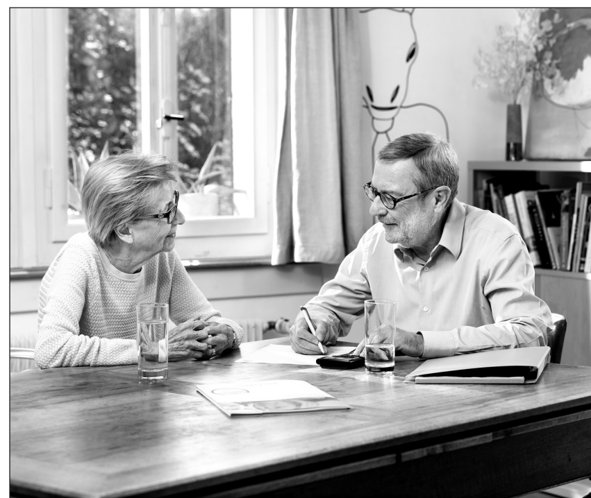
Pro Senectute bietet auch Finanzberatung an.

Die detaillierten Ergebnisse der Umfrage können ab sofort im Ergebnisbericht eingesehen werden. Auf der Website www.bkj-beromuenster.ch unter der Rubrik «Projekte» beim Thema «Bedürfnisanalyse mit Jugend-Event» ist der entsprechende Link zu finden.