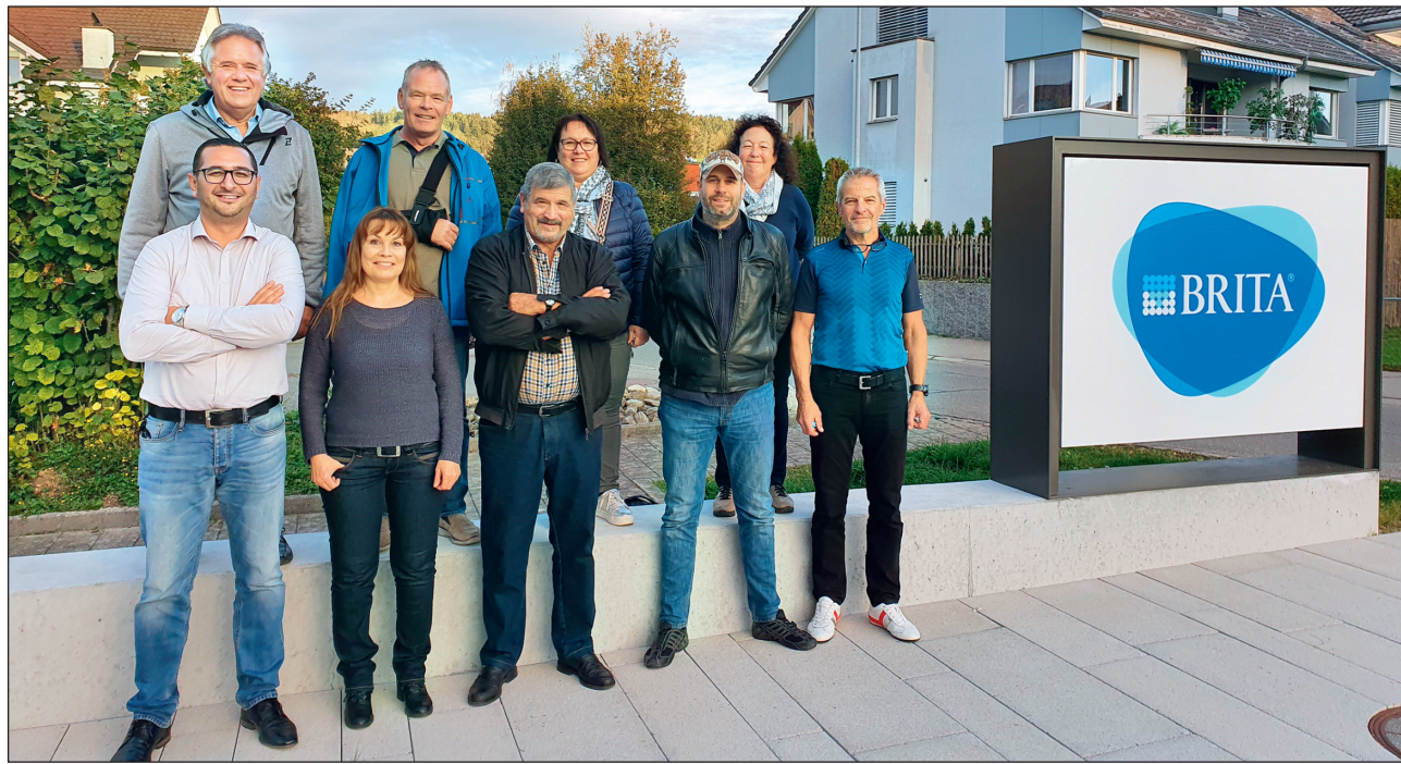
Die Vorfreude ist dem Projektteam ins Gesicht geschrieben. Am 13. Mai 2022 ist in der Region eine weitere Erlebnismacht geplant. (Bild: zvg)

Nach der ersten Auflage im Herbst 2019 sind jetzt die Vorbereitungen für die zweite Erlebnismacht in der 5-sterne-region.ch angelaufen. An verschiedenen Standorten werden interessante Einblicke gewährt.