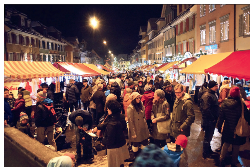
Bald ist wieder der stimmungsvolle Weihnachtsmarkt.

Es gibt diverse Direktvermarktungsangebote im Landwirtschaftsbereich und die Nachfrage nach lokalen Produkten steigt stetig. Was fehlt, ist eine Standortsübersicht für Beromünster.