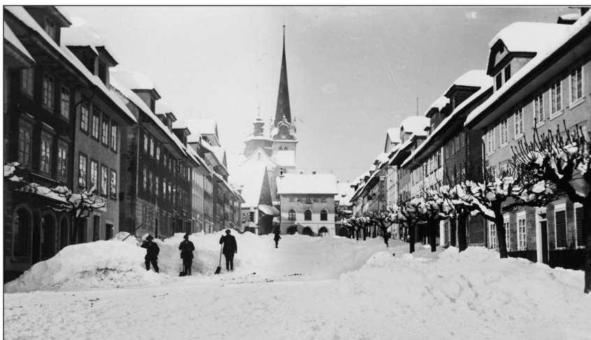
Fotograf: Franz Kopp, Winter 1931.

Fotografinnen und Fotografen aus der Region interessiert. Über https://beromunster.foto-dok.swiss gelangen Sie zum Foto-dok-Gemeindeportal Beromünster. Weitere Infos erteilt: Simon Meyer, Geschäftsstelle Fotodok, Telefon: 041 228 51 16, E-Mail: stiftung@fotodok.swiss