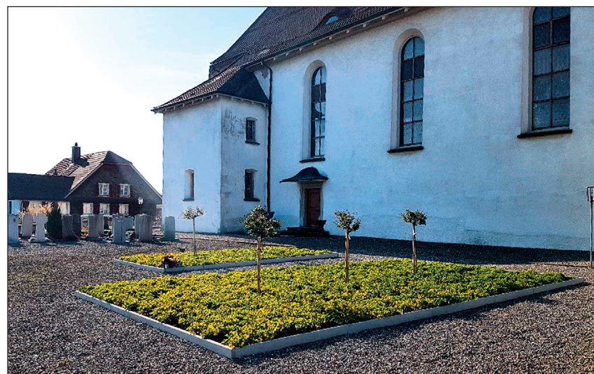
Grabfelder für Reihengräber (vorne) und Gemeinschaftsgrab für Urnenbeisetzungen (hinten).

Die Einwohnergemeinde, welche für die Friedhöfe zuständig ist, regelt insbesondere die Verwaltung des Friedhofs, die Anlage der Gräber, die Einzelheiten über die Grabmäler und die Ausschmückung der Gräber. Aus diesem Grund ist es wichtig, dass die