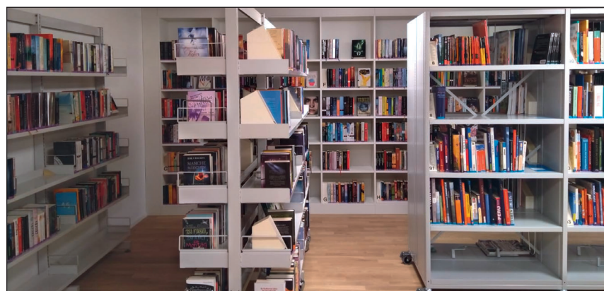
Die neue Bibliothek ist grosszügig gestaltet.