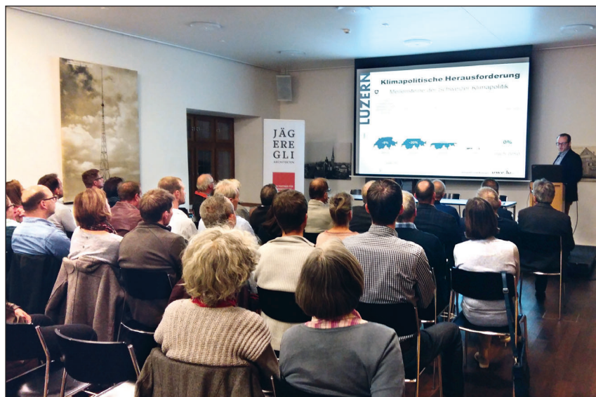
Der Infoanlass stiess auf grosses Interesse.