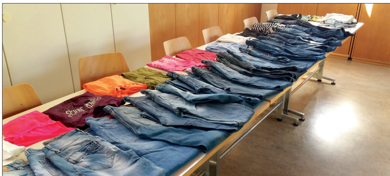
«I put on my Jeans and I feel alright!» – Ganz gemäss diesem Songtext lässt es sich stöbern...