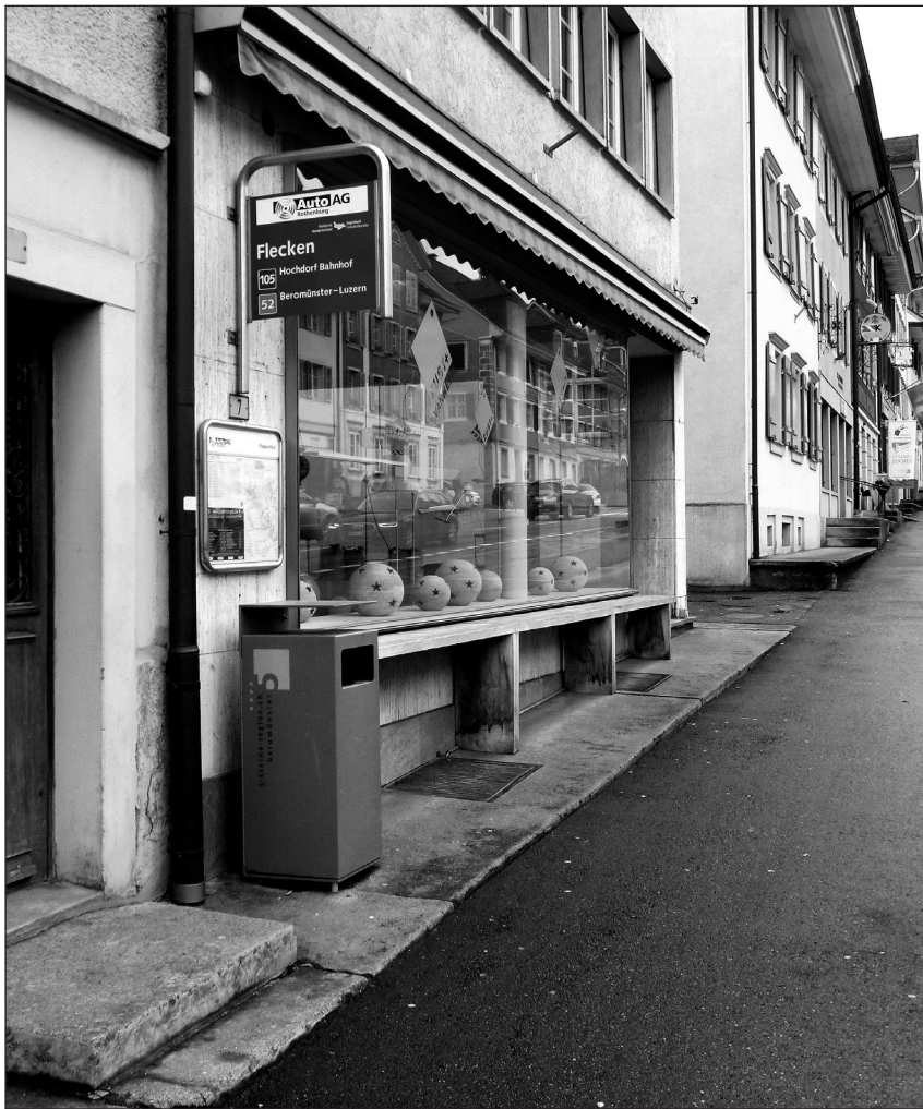
Saubere Bushaltestelle Flecken mit Abfalleimer und Aschenbecher.

Grundsätzlich ist die Bevölkerung heute in Bezug auf Littering gut sensibilisiert und die Littering-Situation hat sich seit einigen Jahren stetig verbessert. Trotzdem haben wir in Beromünster immer noch an verschiedenen Orten gegen das Littering zu kämpfen. Brennpunkte dabei bleiben leider immer noch die Bushaltestellen. Um dem Littering gezielt im Fläcke Beromünster entgegenzuwirken, stehen an diversen Standorten Abfalleimer mit Aschenbecher der 5-sterne-region.ch zur Verfügung. Immer wieder muss leider festgestellt werden, dass vor allem beim Busbahnhof und der Bushaltestelle Flecken in Richtung Luzern Abfälle und Zigarettenstummel achtlos auf dem Boden landen, anstatt dass diese korrekt im bereitstehenden Abfalleimer mit