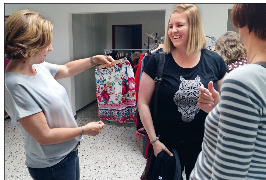
... und Spass haben beim Ausschauen neuer Outfits.