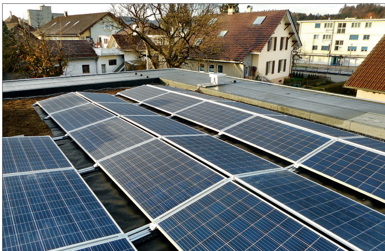
Neuanlagen oder Anlagenerweiterungen von Solarkollektoren werden durch den Kanton Luzern gefördert.